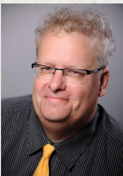
Andreas Schulte Superintendent des Evangelischen Kirchenkreises Schwelm